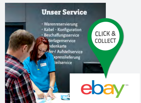
eBay Click & Collect in der Filiale