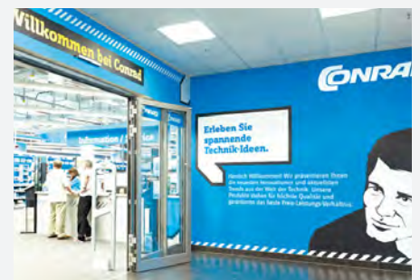
Filiale von Conrad Electronic