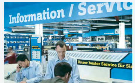
Filiale von Conrad Electronic

Der Omni-Channel-Versandhändler Conrad Electronic nutzt die eCommerce-Integrationsplattform Speed4Trade CONNECT von Speed4Trade mit der wegweisenden eBay-Funktion Click & Collect. Die Bedürfnisse des Kunden stehen für das Unternehmen an erster Stelle. So auch bei der