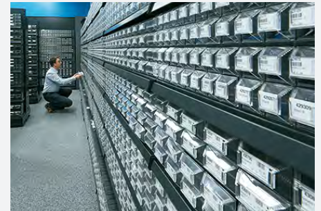
Bauteilebereich in Conrad-Filiale

Mit der hochperformanten Integrationssoftware Speed4Trade CONNECT erfolgte die Einbindung von Click & Collect in die vorhandene Systemlandschaft reibungslos und zuverlässig. Speed4Trade CONNECT verzahnt routiniert und leistungsstark das bestehende Warenwirtschaftssystem SAP mit den verschiedenen Verkaufskanälen – in erster Linie mit dem reichweitenstarken eBay-Marktplatz. Effizient bildet die Software die gesamte Prozesskette von Conrad ab. Für den problemlosen Kauf und die Abholung der Ware in der Conrad-Wunschfiliale werden alle wichtigen Daten zwischen Plattform, Filiale und Kunde automatisiert ausgetauscht.