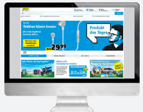
Online-Shop Conrad Electronic